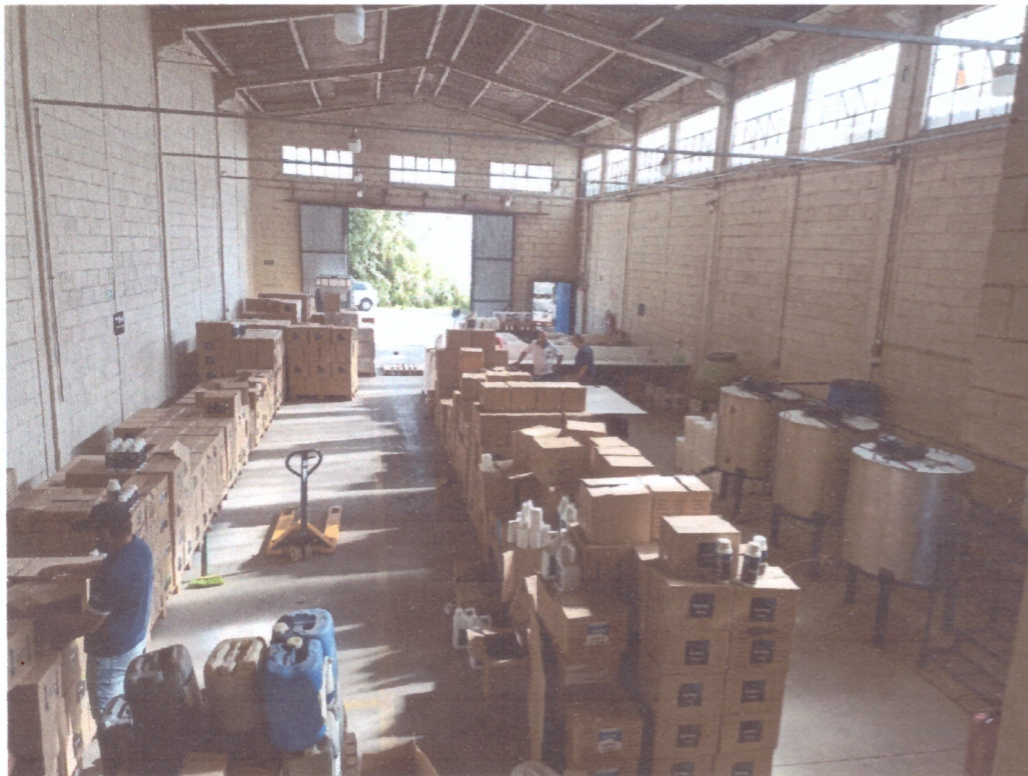
EMPRESA KINAGRO AGROSCIENCES COMERCIO DE AGROQUIMICOS LTDA Diligência realizada pela CAI em 08/04/2022