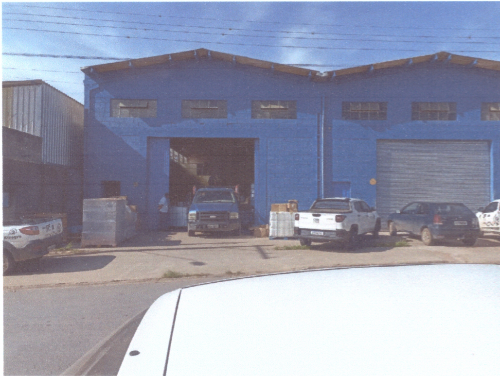
EMPRESA KINAGRO AGROSCIENCES COMERCIO DE AGROQUIMICOS LTDA Diligência realizada pela CAI em 08/04/2022