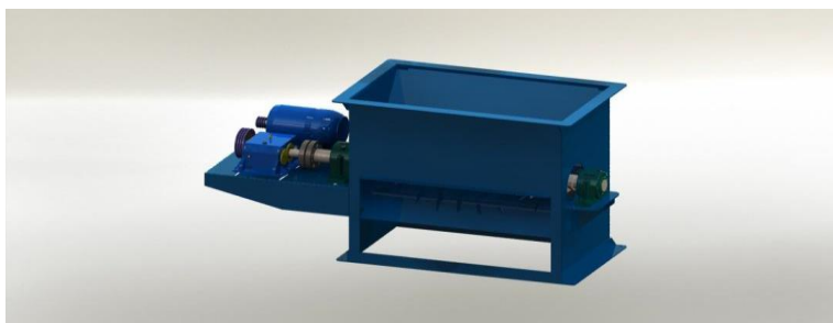
Fig.1: Pré-triturador PN 1711