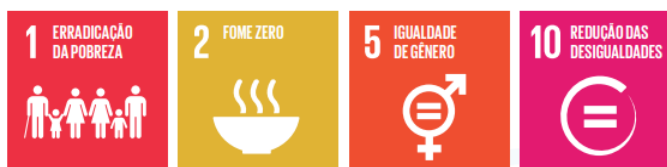
Figura 2: Agenda 2030 x Política de Assistência Social