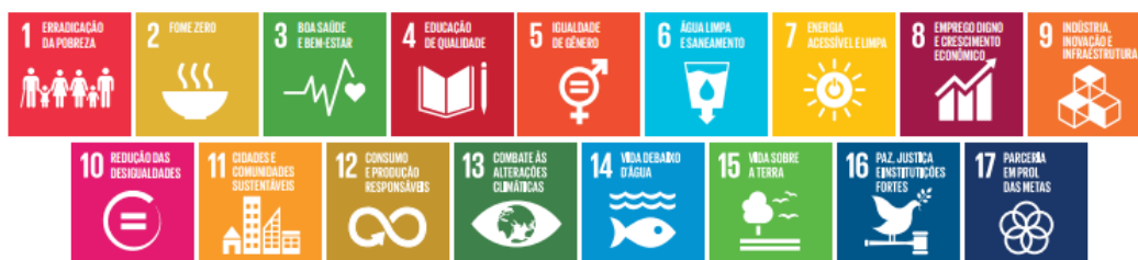
Figura 1: ODS - Objetivos do Desenvolvimento Sustentável